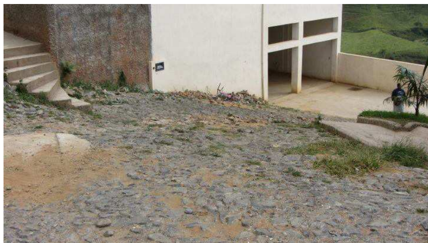
Figura 3 – Análise de segurança no uso e operação: acesso à garagem coberta de um dos blocos de edifícios

Já com relação à segurança no uso e operação , uma vez que o conjunto habitacional não previu espaços destinados para confinamento de gás, não existe o risco relacionado ao uso desse subsistema nos blocos de edifícios. Um aspecto relevante está no acabamento das fachadas que, por serem revestidas apenas com pintura, objetivou o baixo custo da obra e evitou riscos aos usuários relacionados com o descolamento de placas. Um dos riscos observados está no acesso ao condomínio, caracterizado por falhas no calçamento aliado ao declive acentuado para pedestres (Figura 3).