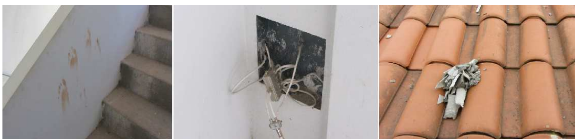
Figura 5 – Análise de durabilidade e manutenibilidade nas edificações

A ausência de componentes internos a diversos subsistemas da edificação relaciona-se com os quesitos de durabilidade e manutenibilidade estipulados em norma. Degradação, falhas de instalação de equipamentos elétricos, telhas cerâmicas quebradas e/ou apresentando sujidades compõem a realidade observada pela ausência da manutenção predial nos blocos de edifícios (Figura 5).