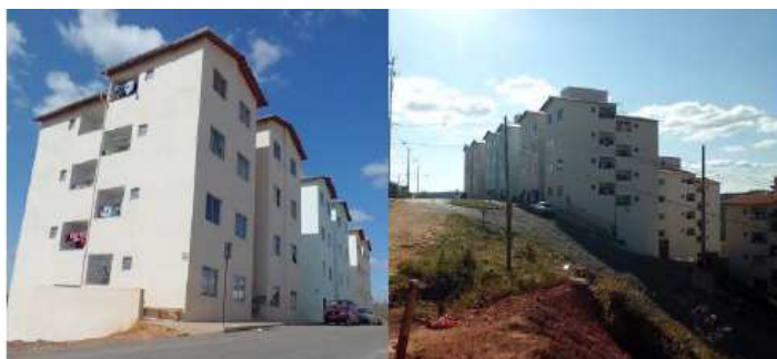
Figura 1 – Vistas parciais do condomínio residencial

O estudo de caso foi realizado nos blocos de edifícios do Conjunto Residencial Floresta, localizado na cidade de Viçosa, Minas Gerais. Trata-se de um condomínio vertical composto por cinco blocos de quatro pavimentos, com quatro apartamentos por pavimento, totalizando 80 unidades habitacionais (Figuras 1 e 2).