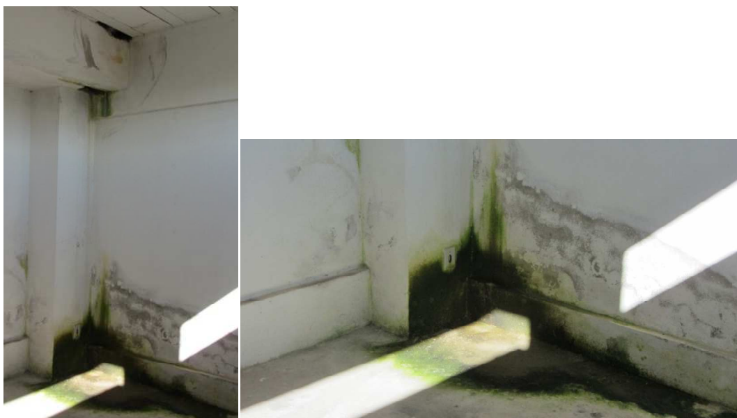
Figura 4 – Análise de estanqueidade: salão de festas de um dos blocos de edifícios