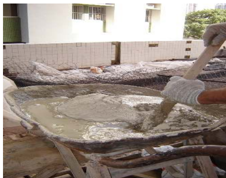
Figura 5 - Mistura manual da argamassa colante na edificação E

A quantidade de água utilizada para a mistura da argamassa nas edificações A, B e D foi a recomendada pelo fabricante. Entretanto, nas empresas C e E não foi verificado qualquer dosador para adição de água no recipiente de mistura. Além disso, foi observado em todas as edificações que a mistura foi realizada de modo manual, com variação no tempo em que ficam sendo homogeneizada, diminuindo a produtividade. Ilustra-se tal fato através da figura 5, a qual se observa um funcionário executando a mistura da argamassa na edificação E.