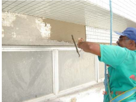
Figura 2 - Aplicação da argamassa colante com a desempenadeira de aço na edificação B

madeira, o qual compromete a produtividade do operário à medida que este necessita interromper o serviço para a montagem ou desmontagem do equipamento; contudo, nas edificações C, D e E a plataforma é metálica; de movimentação elétrica na edificação D, tornando o serviço bastante produtivo.