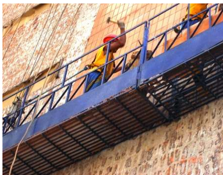
Figura 4 - Retirada do revestimento apenas com a marreta na edificação E

A limpeza inicial consistiu na retirada do revestimento antigo para a preparação da implantação do novo revestimento, desagregando a parte superficial da fachada. Na empresa C e E não se observou a utilização da talhadeira conforme visualizado da figura 4, situação que aumenta a quantidade de fragmentos pequenos que são atirados em decorrência do impacto da marreta, aumentando o risco de acidentes na edificação.