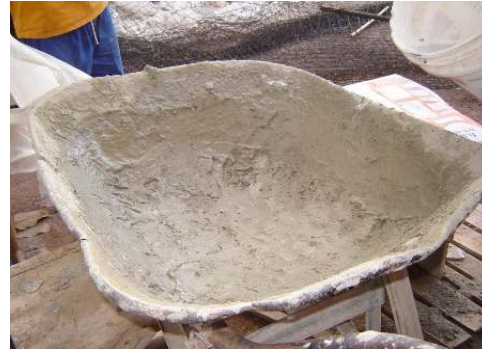
Figura 3 - Recipiente incrustado com resíduo, utilizado para mistura de argamassa na edificação E