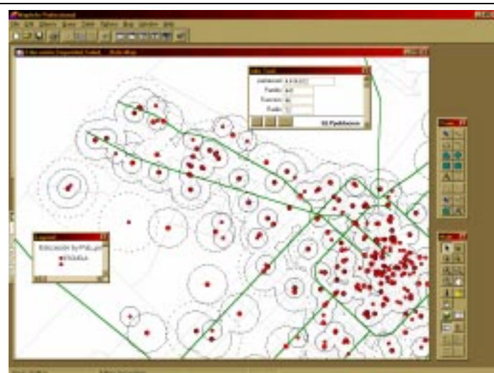
Figura: Red de Educación. Areas de cobertura . “n4i”