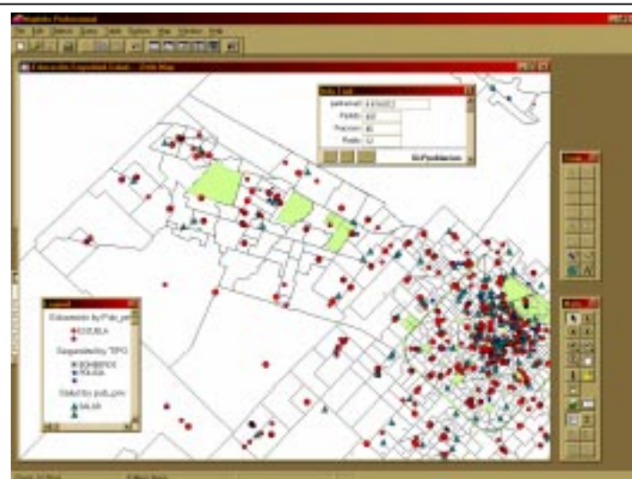
Figura: Localización de Servicios y Espacios Verdes. “n4i”.