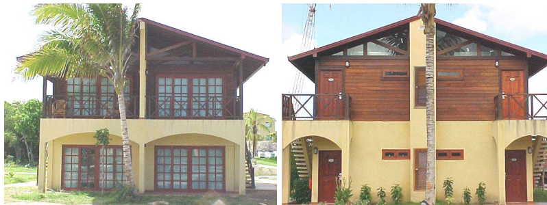
Figura 11y12, Cabaña de dos niveles