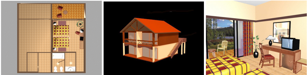
Figura 8,9 y 10, Cabaña de dos niveles (ACAD)