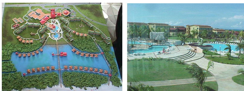
Figura 1 y 2, Plan General Hotel La Laguna.

La superficie de la parcela es de 9.2 hectáreas y en ella se integran los principales atractivos naturales del territorio: el bosque, la laguna y la playa. La laguna como elemento natural constituyó el objeto más importante del hotel desde el punto de vista ecológico, pero a su vez por su ubicación y características bióticas fue una barrera para la comunicación desde el bosque (área del emplazamiento) y la playa. Este aparente conflicto, aspecto funcional a valorar en cualquier instalación turística de sol y playa, fue aprovechado como “pretexto” para desarrollar el Plan General mediante soluciones de alojamiento ubicadas sobre pilotes en las márgenes de la laguna.