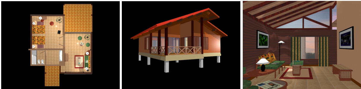
Figura 13, 14 y 15, Cabaña suite sobre pilotes (ACAD)