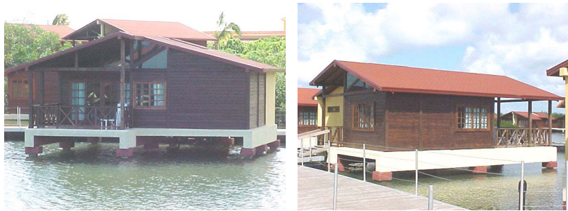
Figura 16 y17, Cabaña suite sobre pilotes.