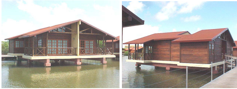
Figura 6 y 7, Vista exterior cabaña de un nivel sobre pilotes