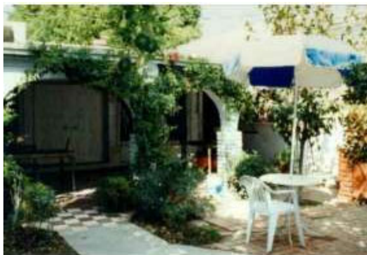
Figura 3. Uno de los patios analizados mas confortables

Las casas latinoamericanas miran hacia el interior a través de los patios, reflejando una forma de ser introvertida, mientras que las casas angloamericanas son extrovertidas. De igual manera que no podemos hablar del surgimiento de la ciudad de Mexicali con sus edificios principales tanto religiosos como de gobierno alrededor de una plaza central como en la mayoría de las ciudades del interior del país, ya que esta ciudad surge con un trazo urbano que guarda una estrecha relación con su vecina ciudad de Calexico California, a la manera de las ciudades norteamericanas, tampoco podemos hablar que exista un concepto de patio como en el interior del país, donde las habitaciones giran en torno a un patio central. En esta ciudad podemos decir que se ha dado este concepto diferente, donde el espacio exterior de las viviendas se fusiona con elementos como el pórtico, las áreas verdes y la cochera, donde se conjuga el juego de los niños con las convivencias en torno a la carne asada.