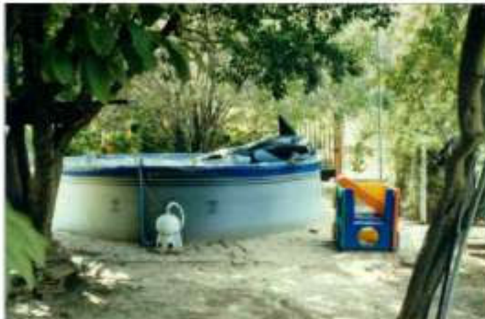
Figura 4. Patios donde se generan sombras con el uso de la vegetación

El tamaño de los lotes de 15 x 57 metros, al ubicar la vivienda al centro del lote, permitió grandes patios que originalmente contaron con caballerizas, albercas, áreas recreativas y que con el tiempo se han ido fraccionando dividiendo los lotes y construyendo vivienda con frente a la calle y vivienda o departamentos con frente al callejón. La ubicación de la casa respecto al lote propició las cocheras lineales, que ofrecen la posibilidad de utilización como un recurso importante de sombra en sus patios.